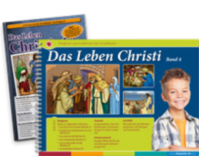
Das Leben Christi • Band 4 Ringbuch (33 cm x 24 cm, 36 Bilder), Textheft und Arbeitsmaterial, inkl. CD-ROM