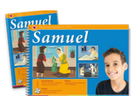
Samuel • Lektionen-Set Ringbuch (33 cm x 24 cm, 12 Bilder), Textheft und Arbeitsmaterial, inkl. CD-ROM