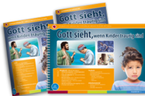
Gott sieht, wenn Kinder traurig sind • Lektionen-Set Ringbuch (33 cm x 24 cm, 30 Bilder), Textheft und Arbeitsmaterial, inkl. Download-Code